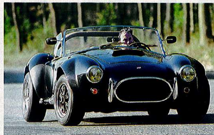
Belle, belle, belle à regarder, et le grand pied à piloter.