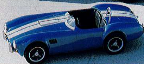
Mini 427 (création Marcarian) deviendra grande.