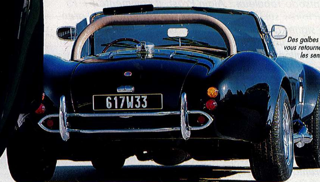
Des galbes à vous retourner les sens.