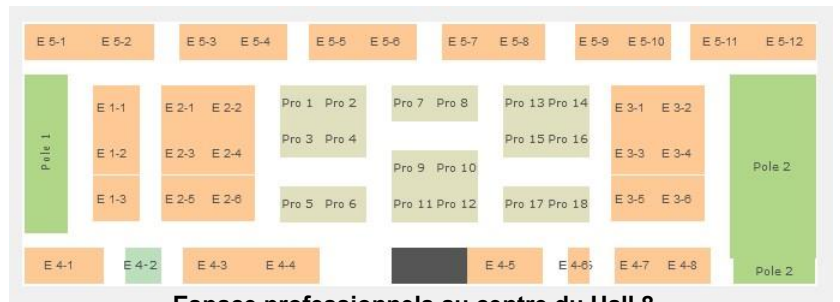
Espace professionnels au centre du Hall 8 Installation le samedi de 7h00 à 13h00.