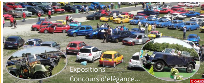
Expositions Concours d'élégance...