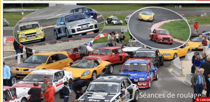
Séances de roulage