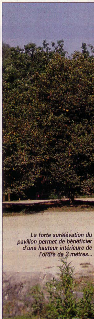
La forte surélévation du pavillon permet de bénéficier d'une hauteur intérieure de l'ordre de 2 mètres...