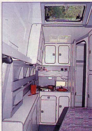
Vue vers l'arrière. Au premier plan, à gauche, la « batterie » de placards ; au fond, le bloc cuisine. Au pavillon, un grand aérateur dans le « décroché » du toit.