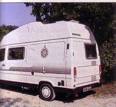
On sent à de petits détails importants à l'usage, que les concepteurs ont vraiment pensé à tout. Exemple : par la baie de la cuisine, la vue vers l'arrière est laissée libre pour utiliser le rétroviseur de cabine.