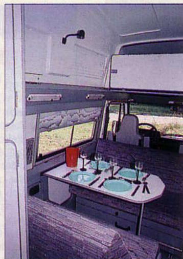
La dinette. Conçue pour quatre convives, elle peut offrir, après basculement de la banquette à l'avant, quatre vraies places « face à la route ».